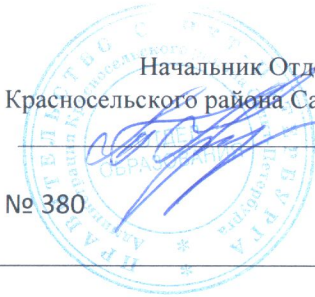
ГРАФИК ПРОВЕДЕНИЯ ВПР 2023 Государственного бюджетного общеобразовательного учреждения школы № 380 Красносельского района Санкт-Петербурга имени А.И.Спирина