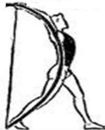
положение "натянутого лука"

При метании гранаты с места, техника двигательных действий такова. В исходном положении стать левым боком к цели, ноги по ширине плеч. Сгибая правую ногу, наклонить туловище вправо. Правая рука с мячом отведена вправо, левая рука согнута перед грудью. Из этого исходного положения выполнить бросок за счет активного разгибания правой ноги, поворота грудью в сторону метания и переноса массы тела на левую ногу. При этом метаящий принимает положение "натянутый лук": обе ноги выпрямлены в коленных суставах, правая ставится с носка, левая стоит на всей стопе, рука с мячом согнута под углом около 120 градусов и отведена назад. Из этого положения без задержки и фиксирования его выпрямить туловище и пронести руку с мячом над плечом. После выпуска снаряда туловище повернуть налево и левую руку отвести в сторону.