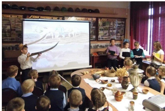
Группы школьников с интересом знакомятся с экспозицией музея