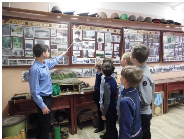
Юные экскурсоводы приглашают Вас на экскурсию

Адрес: 198320, Санкт-Петербург, г. Красное Село, ул. Спирина, д. 2, к. 3, литера А, тел./факс: 741-17-01