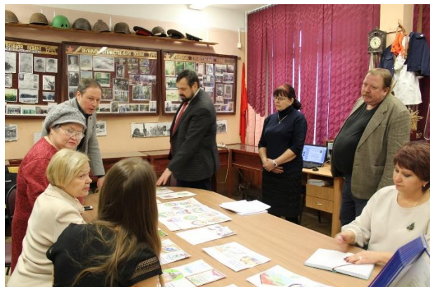
Представители структурных подразделений и ветеранской общественности, Региональная общественная организация «Пермское Землячество в Санкт-Петербурге»